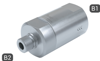
TVR200-S1-A13 with female thread and male thread