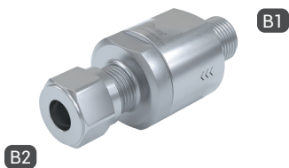
TVR200-S1-A14 with male thread and double ferrule fitting