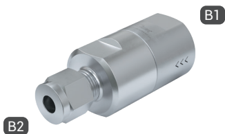
TVR200-S1-A12 with female thread and double ferrule fitting