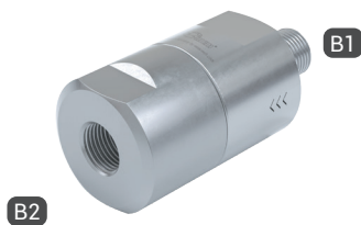
TVR200-S1-A15 with male thread and female thread