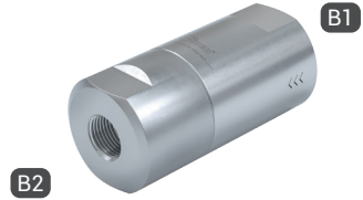
TVR200-S1-A02 with female thread on both sides