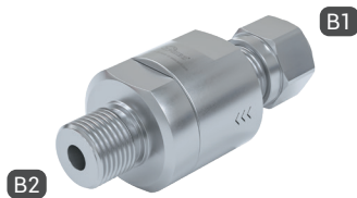
TVR200-S1-A11 with double ferrule fitting and male thread