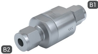
TVR200-S1-A01 with double ferrule fitting on both sides