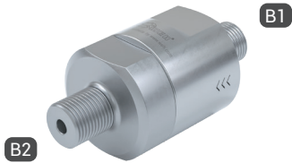
TVR200-S1-A03 with male thread on both sides