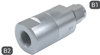
TVR200-S1-A10 mit Doppelklemmringverschraubung und Innengewinde